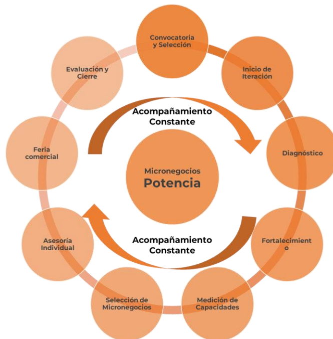
Ilustración 1. Ruta metodológica de MICRONEGOCIOS MANIZALES POTENCIA

Las fases que contempla el programa Micronegocios POTENCIA son: